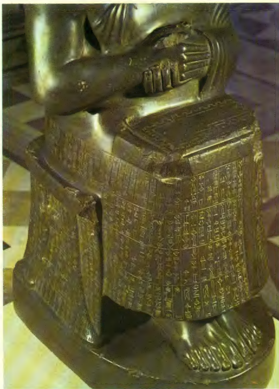
Detalle de una estatua de Gudea con muestras de escritura cuneiforme, el vehículo por el que la literatura babilónica ha llegado a nuestro conocimiento.